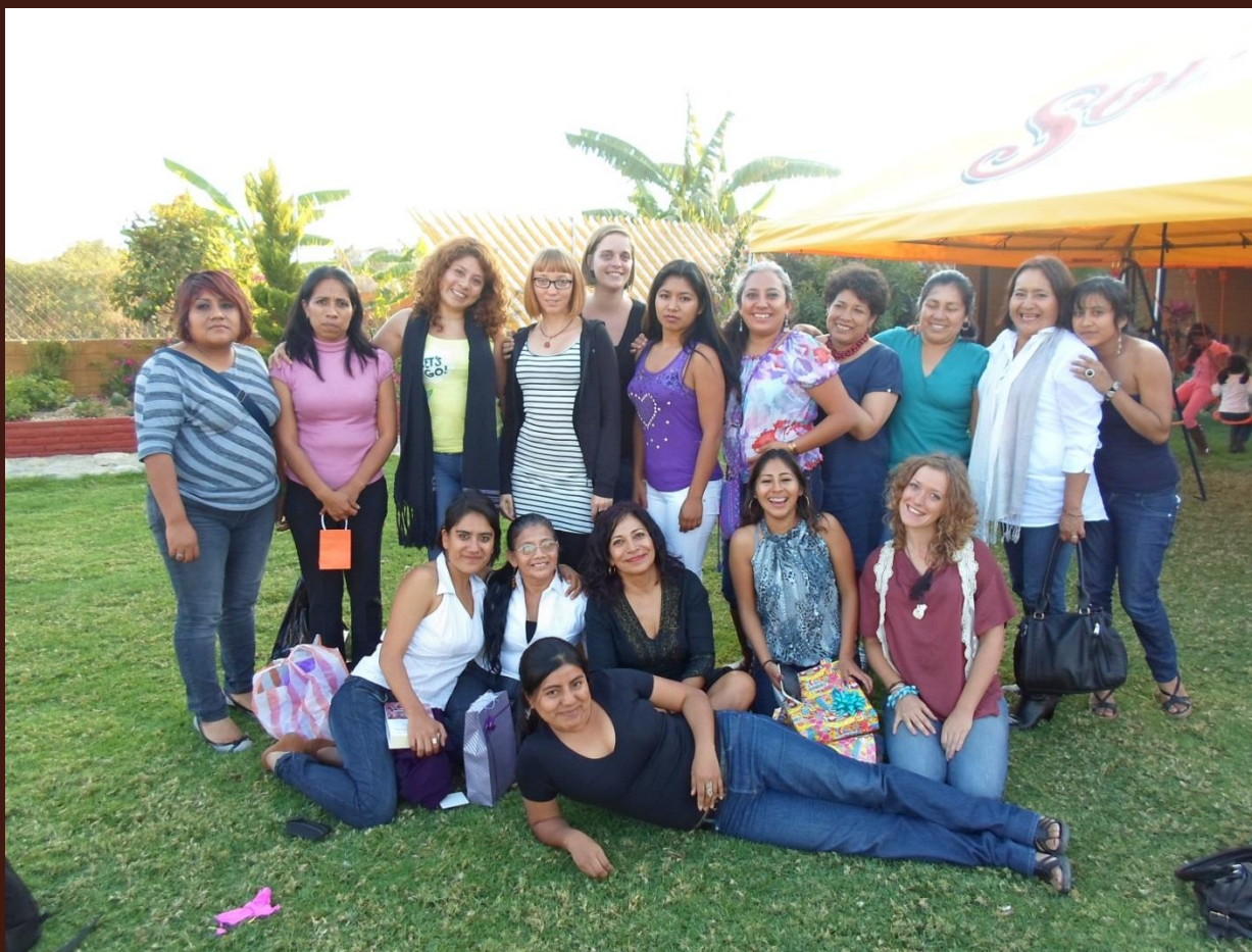
Equipo de Consorcio Oaxaca (2012).